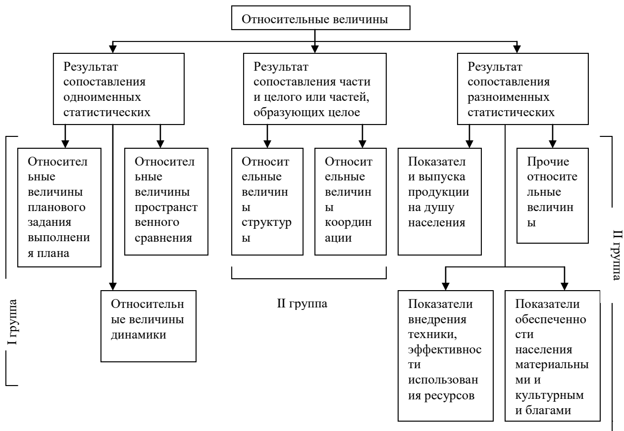
Рис 3.1. Классификация относительных величин

Первая группа относительных величин определяется сопоставлением одноименных статистических показателей. Ее результатом является кратное отношение (коэффициент), показывающее, во сколько раз сравниваемая величина больше (или меньше) базисной. Результат может быть выражен в процентах, если база сравнения, принятая за 100, показывает, сколько процентов сравниваемая величина составляет от базы.