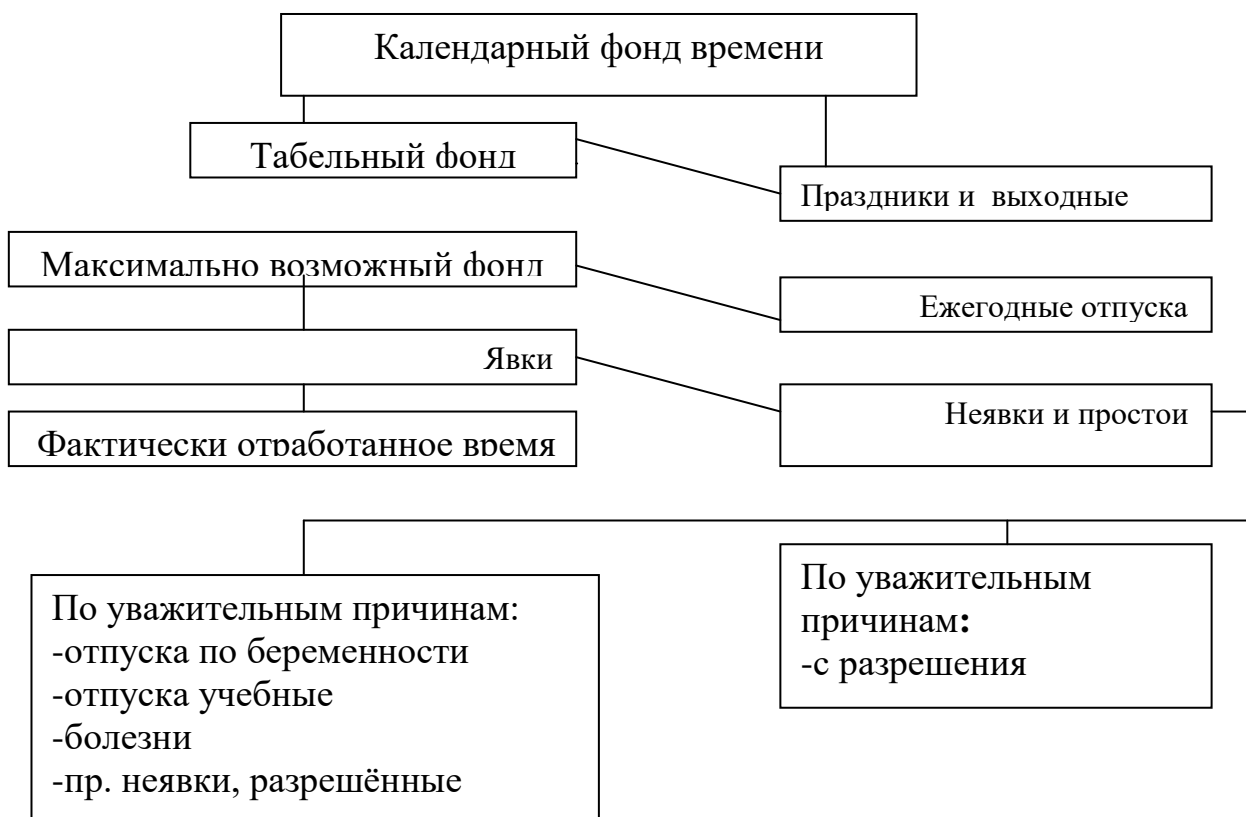
Рис. 4.1 Структура календарного фонда времени

Структура календарного фонда времени как исходного показателя для определения фонда рабочего времени представлена на рис 4.1: