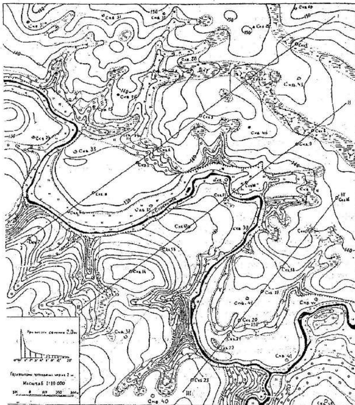
Рисунок 1 – Карта-схема размещения геологических скважин на территории учебного полигона